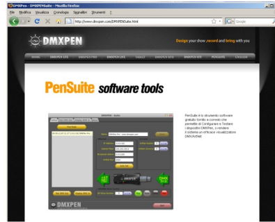
a. Installare PenSuite sul PC

N.B. Arrestare eventuali playback in corso premendo il pulsante a bordo prima di selezionare la modalità.