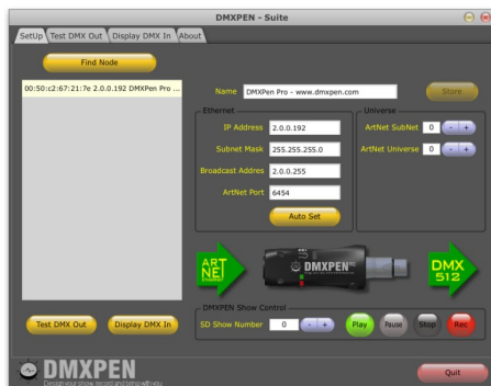
d. Riconoscimento DMXPen connesse e selezione modalità