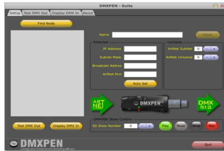
c. Avvio di PenSuite

Dopo aver scaricato PenSuite e connesso la DMXPen al PC possiamo avviarlo. Ricordiamo che la presenza di Firewall sul PC potrebbe impedire un corretto funzionamento del programma, per cui consigliamo di disattivarlo durante questa fase.